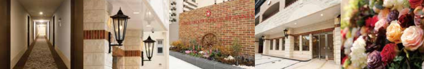
HOTEL SUNROUTE SOPRA KOBE ANNESSO

神戸ハーバーランドまで、徒歩圏内。 4路線が乗り入れる新開地駅から徒歩約2分。 ビジネスにも観光にも便利な立地です。