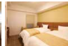
ユニバーサルツインルーム