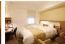
スーパーリアツインルーム