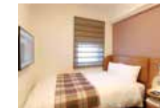
レディースシングルルーム