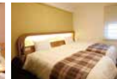
レディースツインルーム